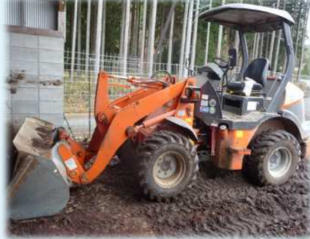
フロントローダー