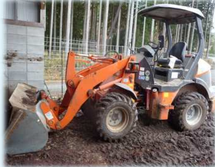
フロントローダー