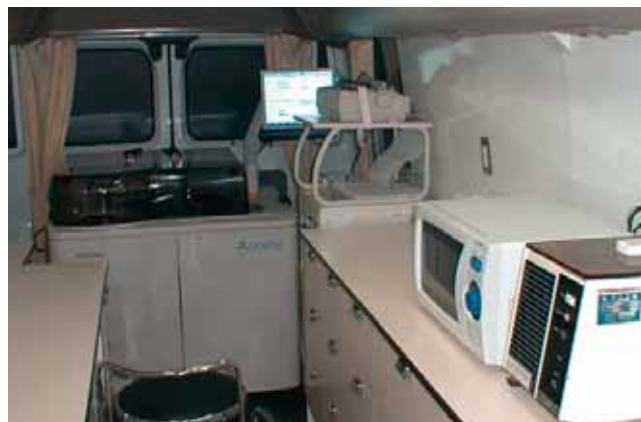
検診車内部(写真奥が血液自動分析装置※8月頃に更新予定)

また従来からの一般損害防止事業も引き続き実施しており、利用料金は20,000円となります。