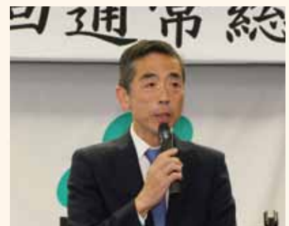
田辺義貴 農林水産省東海農政局長