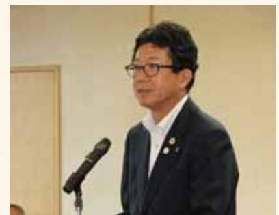
加藤正人 愛知県農林水産部長